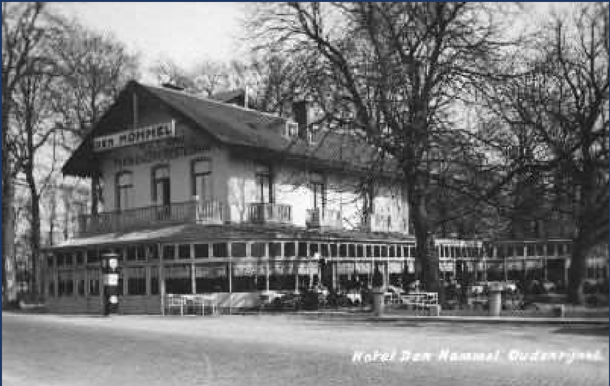
Hotel Café Restaurant Den Hommel, na verbouwing en uitbreiding in 1935.