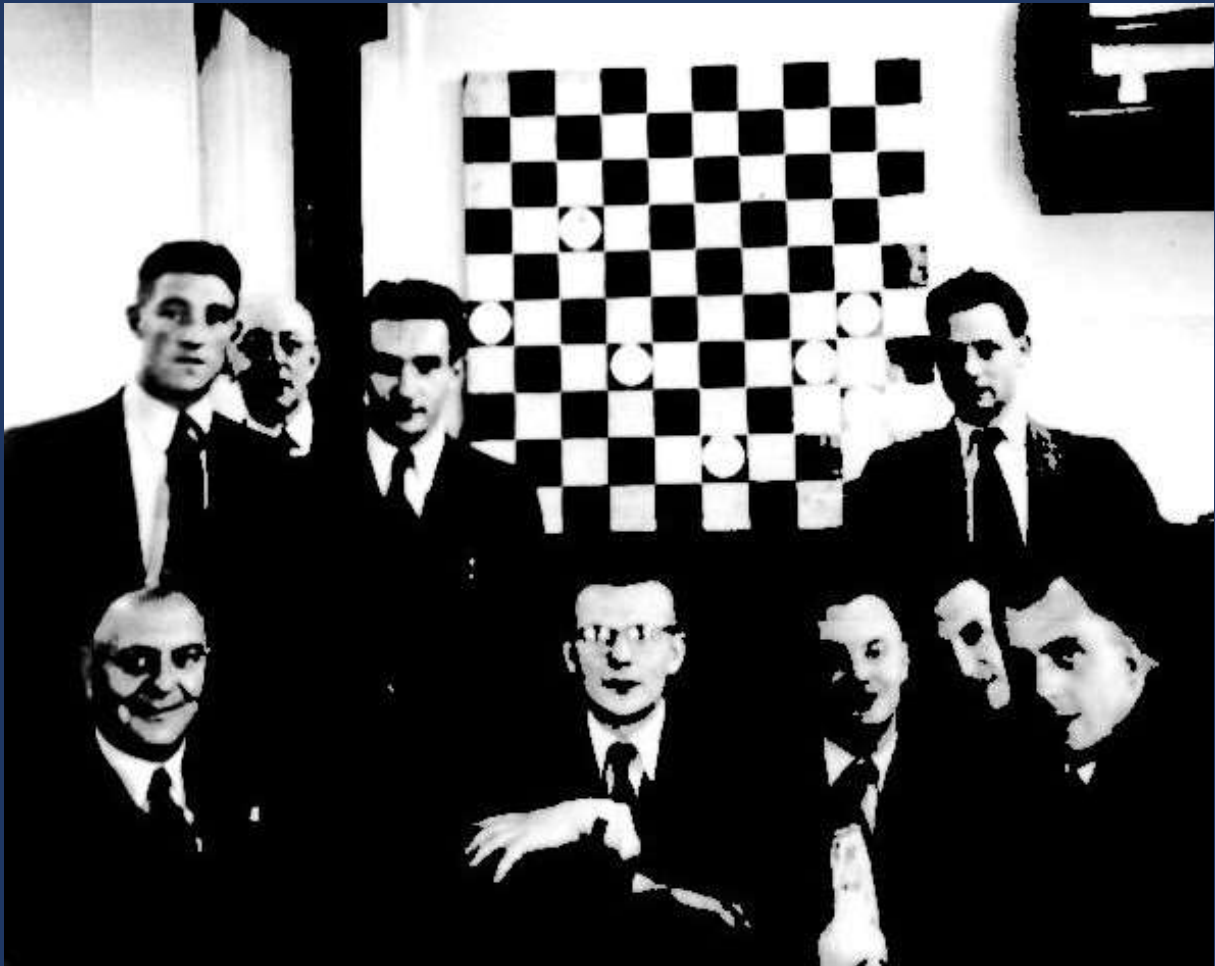
De Kring voor Damproblematiek: een beschouwing van 75 Jaar reünie